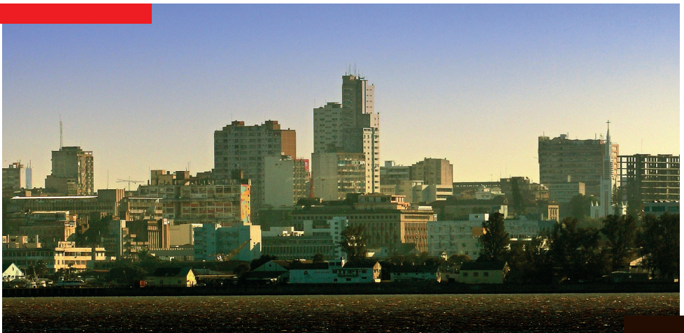
Baía de Maputo, Moçambique

Estas características fazem com que Moçambique atualmente seja uma localização privilegiada para investir.