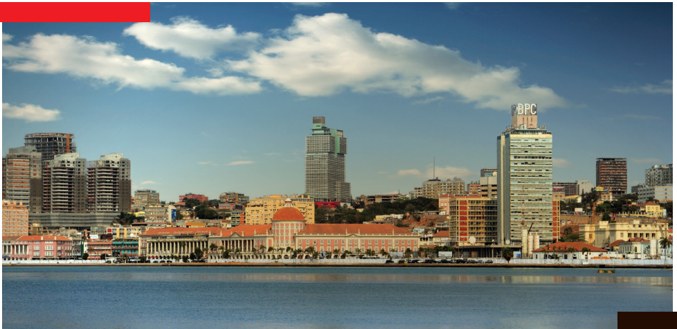
Baía de Luanda, Angola

Este conjunto de características fazem com que Angola seja atualmente uma localização privilegiada para investir.