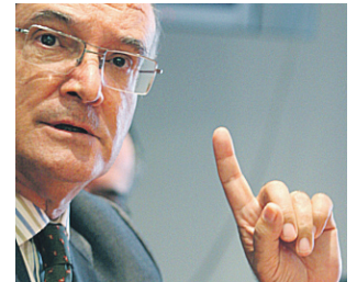
Carnicer avisa. DSG

Para el futuro, Santos tiene claro que “creceremos si el mercado nos permite crecer”. Pero el objetivo de expansión no está tanto en Portugal como en el extranjero, por ejemplo en Angola, donde la firma va a asociarse con una despacho local que ha puesto en marcha un abogado que ya pasó por las filas de PLMJ. ❖