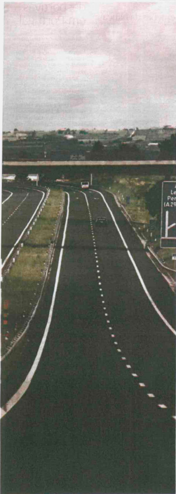
Os custos elevados que o Estado tem de suportar.