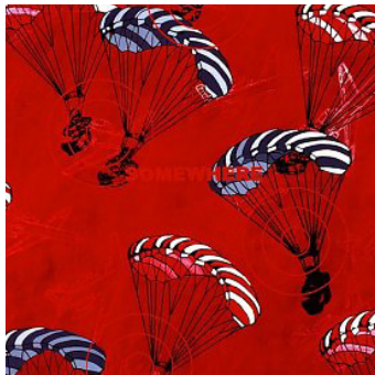
Joana Rêgo (Detalhe) Landing, 2004 Acrílico sobre tela de linho 100 x 100 cm Colecção Fundação PLMJ