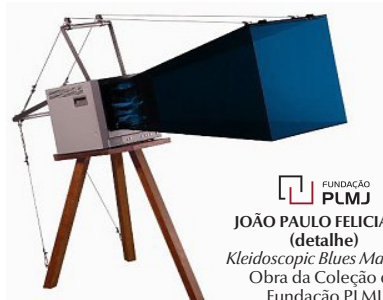
FUNDACÃO PLMJ JOÃO PAULO FELICIANO (detalhe) Kleidoscopio Blues Machine Obra da Coleção da Fundação PLMJ