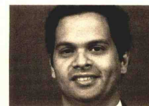
URÍA MENÉNDEZ Duarte Brito de Góis

■ A PLMJ acompanha toda a operação desde o momento inicial de planeamento e estruturação, fazendo trabalho de concepção e desenho das soluções jurídicas mais adequadas.