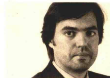
PLMJ Martim Pedro Morgado

■ A equipa de advogados da VdA desempenha um papel activo em todas as fases do projecto, desde a análise de viabilidade e estruturação, passando pelo 'due diligence' legal, 'drafting', negociação e concretização.